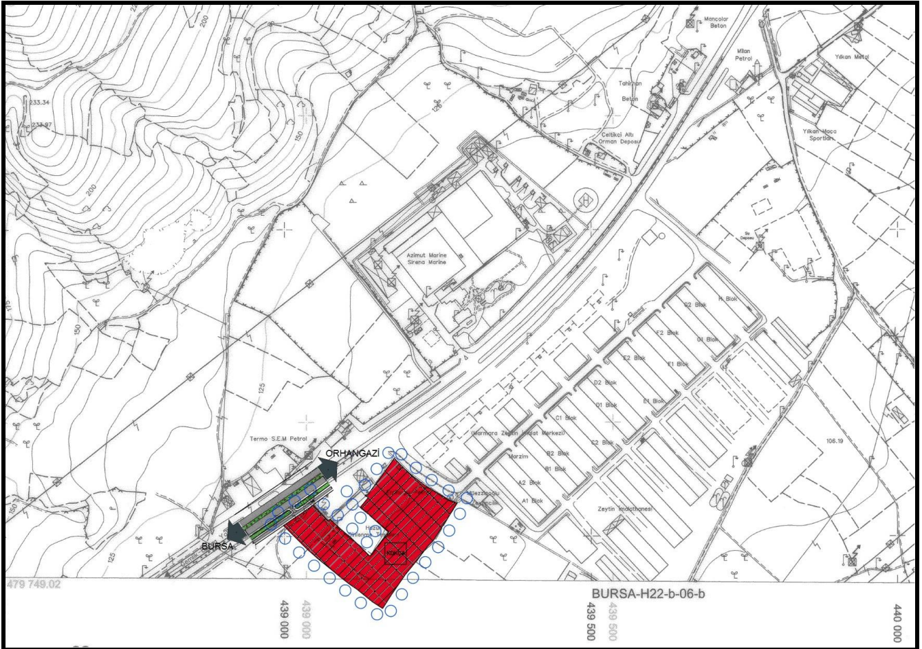
Tablo 1: Alan Dağılımı Tablosu